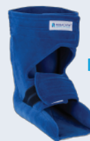
Orthopedic Bandage shoe / heel protector

After intensive use for a period of 6 months in terms of cleaning and hygiene (exudate), REBACARE® recommends that the product is regularly inspected and replaced if necessary.