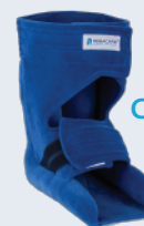
Chaussure bandage / protecteur entier

Au bout de 6 mois d'un usage très intensif, REBACARE® conseille de vérifier le produit régulièrement pour des raisons de nettoyage et d'hygiène (exsudat) et au besoin de le remplacer.